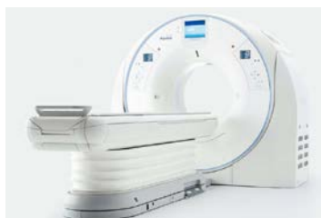
320列マルチスライスCT