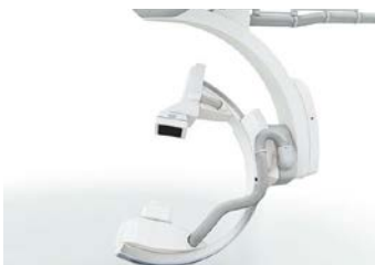
最新式のシネアンギオ装置（カテーテル室）