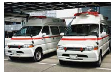
モービルCCU（ドクターカー）